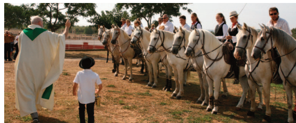
Journée à l'ancienne