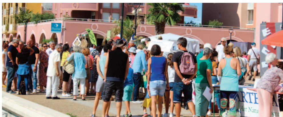
Farandole des associations